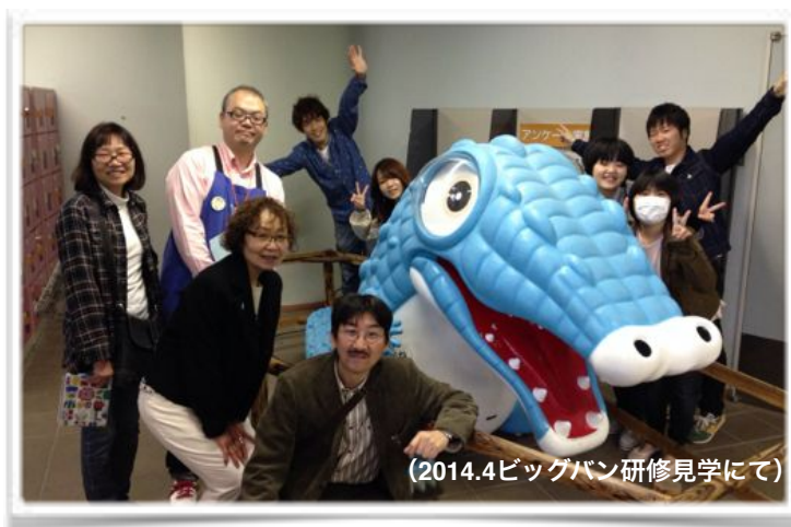
(2014.4ビッグバン研修見学にて)

絵画制作実技指導 あすなる絵画研究所の講師4名による制作の実際 場所：サクラクレパス大阪本社ビル